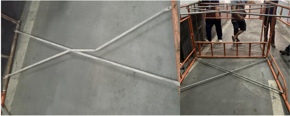
图 16、17 涉事移动门式作业架剪刀撑受损情况及作业平台安装方式