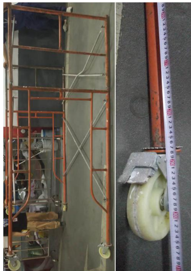
图 15 涉事移动门式作业架复原情况

事发时伤者使用的是移动门式作业架。架体长1.8m、宽1.2m，架体总高度3.05m，中间层平台高度2.08m，未在移动就位后使用前设置抛撑 [1] （高宽比：约 2.54 > 2 ）；架顶层作业平台为加设的0.5m宽脚手板，未满铺，且未设置防护栏和挡脚板 [2] 。