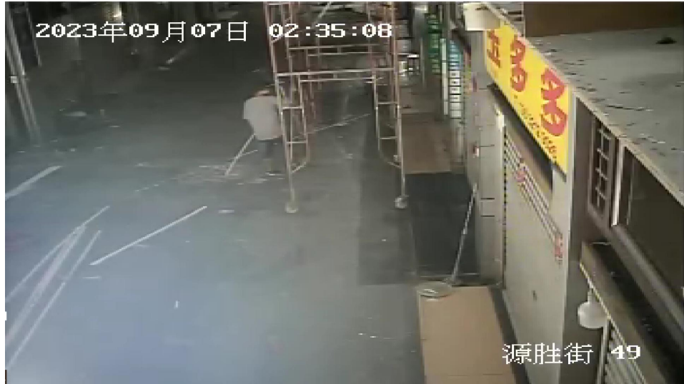
图 11 涉事移动门式作业架滑动瞬间 (图显时间约慢 1 分钟)