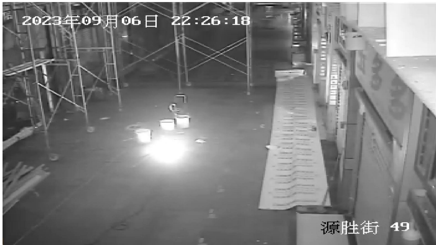
图8 完成施工前作业准备，开始正式作业 (图显时间约慢1分钟)

22时27分，2个移动门式作业架均搭设完毕，朱某某、汪吉生、聂某某完成施工前作业准备，开始正式作业，本次任务是完成源胜街通道上方线管和线槽的固定安装。