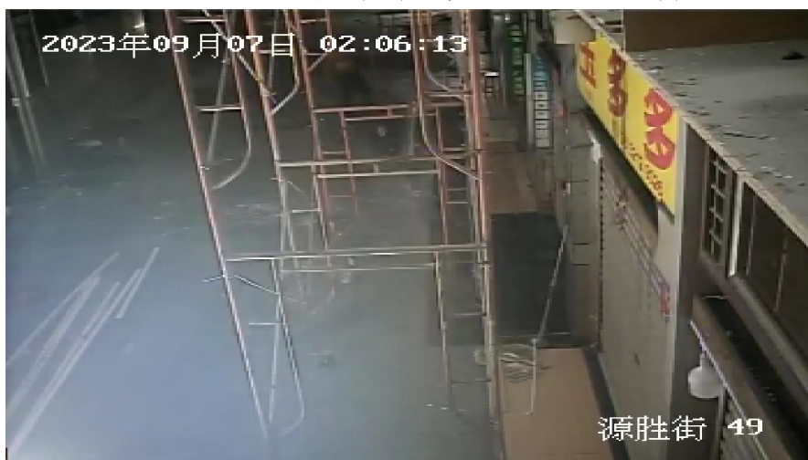
图 9 汪吉生将涉事移动门式作业架推移至事发位置并固定万向轮 (图显时间约慢 1 分钟)

业。此时聂某某正在旁边约 5m 高的移动门式作业架顶部固定线槽，朱某某在下方地面为汪吉生、聂某某递送工具和材料。