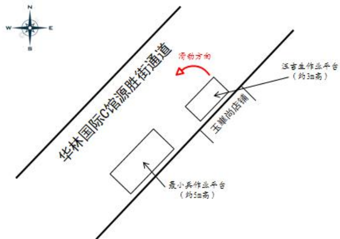
图 14 事发现场平面示意图