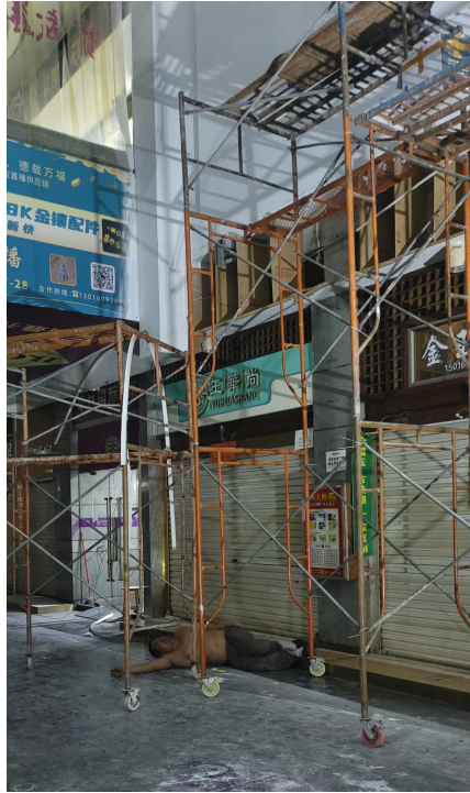
图 13 汪吉生倒地不起，上身赤裸，未佩戴安全帽，未系挂安全带 （工友第一时间用手机拍摄的照片）