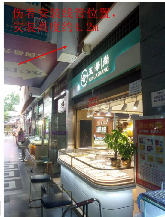
图 18、19 事发现场示意图