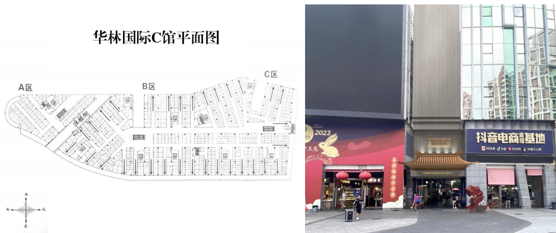
图1、2 华林国际C馆平面图及装修工程源胜街通道门头效果图

华林国际C馆源胜街通道装修工程（以下简称装修工程），是对华林国际C馆源胜街通道进行装修改造，具体包括门头、琉璃瓦屋顶、门头吊顶、大门招牌、满洲窗、走廊吊顶钢丝、吊顶装饰、通道二侧滚动灯箱、走廊广告灯箱、走廊招牌、商业街墙面刷新共11项施工内容，工程造价22.5万余元。工程于2023年8月中上旬开工，属限额以下小型工程 [1] ，事发前未报送属地街道办理开工建设信息录入管理手续，事发时正在进行的是用于灯饰灯箱招牌等的线缆敷设（以下简称线缆敷设）作业。