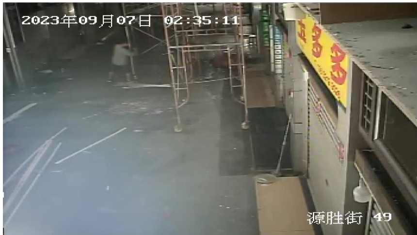
图 12 汪吉生从移动门式作业架跌落瞬间 (图显时间约慢 1 分钟)