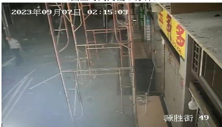
图 10 汪吉生爬上涉事移动门式作业架开始施工作业 (图显时间约慢 1 分钟)

9 月 7 日 02 时 36 分，约 3m 高的移动门式作业架突然滑动，汪吉生瞬间从移动门式作业架跌落（跌落过程中，伤者身体砸弯剪刀撑），倒地不起。事发时，汪吉生上身赤裸，未佩戴安全帽，未系挂